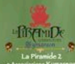
La Piramide 2 e Associazione Kyriatreeon