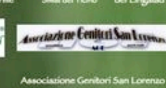
Associazione Genitori San Lorenzo